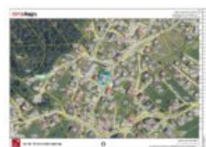
Lageplan - Ferne