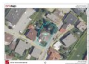
Lageplan - Nahe