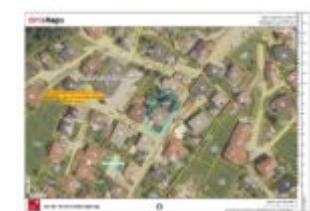
Gefahrenzone in Überarbeitung