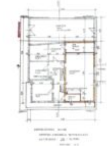
Grundriss Top 1 - Obergeschoss