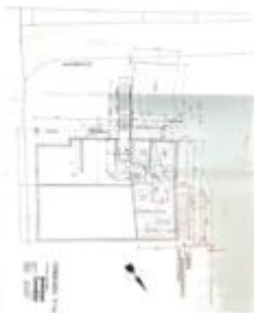
Grundriss - Top 3