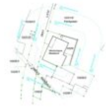
Wohnhaus Ötz - Lageplan