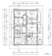
Wohnhaus Ötz - 2. Obergeschoss