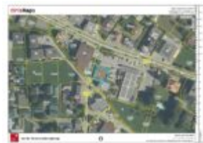
Lageplan aus der Nähe