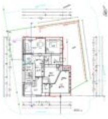
Wohnhaus Ötz - Erdgeschoss