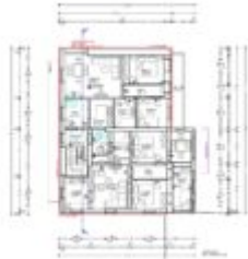
Wohnhaus Ötz - 1. Obergeschoss