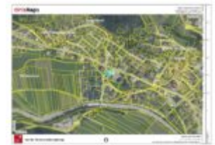
Lageplan aus Entfernung