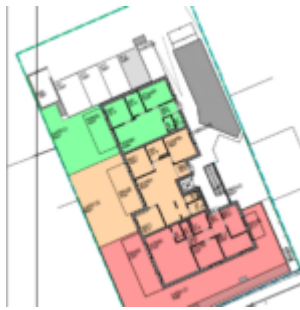
Grundriss Top 1