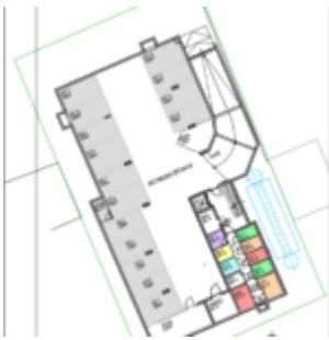
Grundriss TG_KFZ10 und Kellerabteil