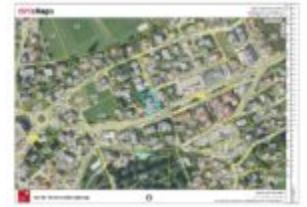
Lageplan / Tiris