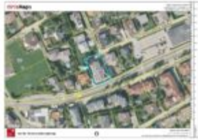
Lage im Ort / Tiris