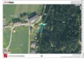
Lageplan mittlere Parzelle Lageplan kleine Parzelle Gefahrenzone