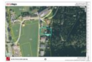
Lageplan große Parzelle