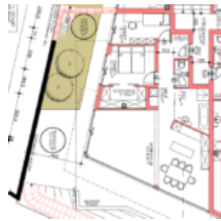
Grundriss Top 3