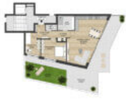
Grundriss Top 3