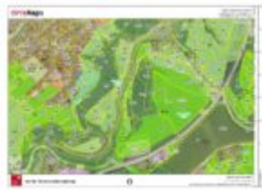
Lage mit eingezeichnetem Grundstück